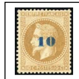
N° 34 sur demande

L'avantage des timbres classiques avant 1900, par rapport aux timbres modernes, c'est qu'ils conservent une valeur même avec défaut. Il faut savoir que 80% des timbres de cette période existent en qualité moindre et qu'il aurait été absurde de ne pas considérer cet état de fait, par un cours réel, sur le marché philatélique. Les grosses valeurs deviennent ainsi accessibles dans la qualité de votre choix. Les variétés de couleur, non indiquées, peuvent être fournies, sur demande, selon disponibilité. Les timbres NEUFS * de cette période sont plus difficiles à réunir. Néanmoins, nous pouvons les fournir en grande partie. Les fourchettes de remises sont semblables aux oblitérés selon la qualité. Photos en couleur des timbres désirés sur demande précise. Les timbres NEUF re-gommés ou avec gomme trop altérée ont pour base la cote NEUF sans gomme. (Catalogue Yvert N° 1 à 60 et Maury 61 à 106 pour les sans gomme ; remise proportionnelle.)